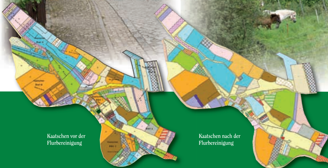
Kaatschen vor der Flurbereinigung